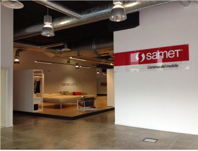
Samet SRL / Samet İtalya/Bergamo