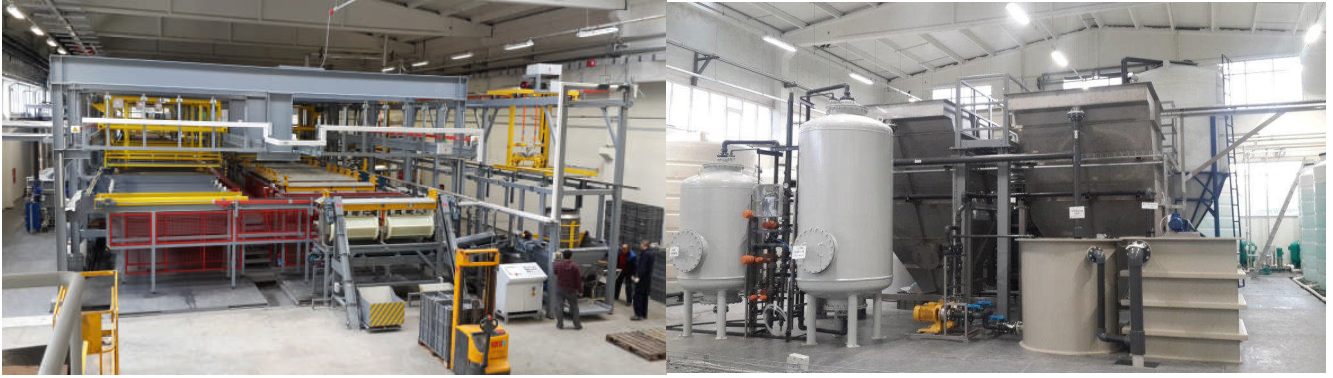
Çerkezköy Tam Otomatik Kaplama Tesisimiz(2014)

Bununla birlikte, kademeli olarak İstanbul'da yerleşik Menteşe Preshane, Menteşe Montaj ve Menteşe Dışı Montaj Üretim tesisimizin 2016'da Çerkezköy'e taşınması öngörülmektedir. Bu kapsamda, Çerkezköy'de yeni satın alınan tesiste, tadilatlar başlamıştır. 2016 sonunda taşınmanın tamamlanması beklenmektedir.